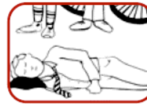
3. Turn on side and keep airway clear.