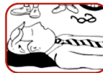
1. Cushion head, remove glasses.