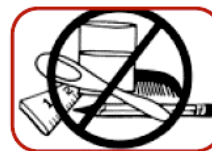
5. Don't put anything in mouth.