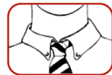
2. Loosen tight clothing.