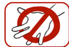
6. Don't hold down.